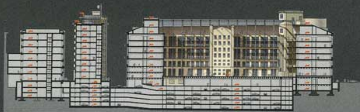
Деловой центр “Телеграф” на Тверской и здание Госкомитета по телекоммуникациям

качать не в стремлении сохранить исторический облик центра, а, скорее, в неосознанном желании уйти от безликих коробок “развитого социализма” в предреволюционное буржуазное прошлое.