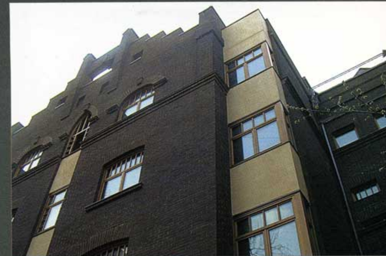
Реконструкция жилого дома в Чистом переулке

Москва, Чистый переулок, дом 10/3–5, стр. 2. Строительство – 1997–1999 гг. Архитекторы: Сергей Скуратов, Михаил Чирков, Сергей Киселев