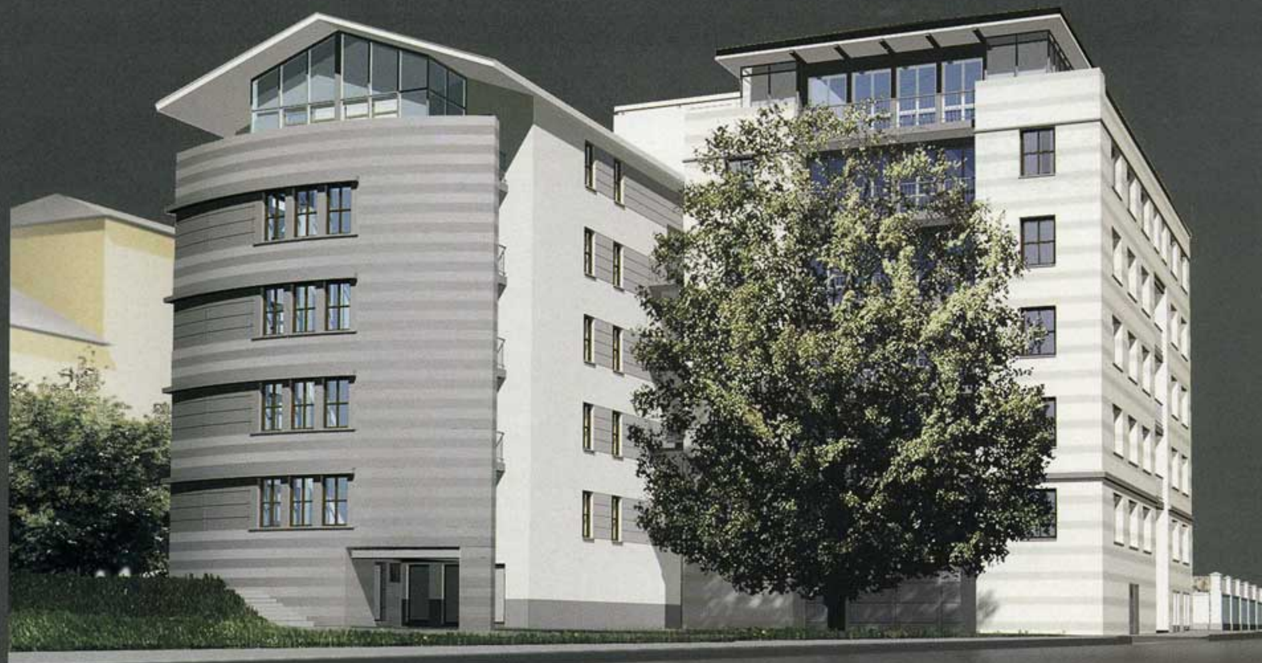
Жилой дом с подземной автостоянкой в Zubовском проезде Москва, Zubовский пр., влад. 1. Строительство – 1999–2000 гг. Архитекторы: Сергей Скуратов, Михаил Чирков, при участии Сергея Киселева, Евгения Анваера

качать не в стремлении сохранить исторический облик центра, а, скорее, в неосознанном желании уйти от безликих коробок “развитого социализма” в предреволюционное буржуазное прошлое.