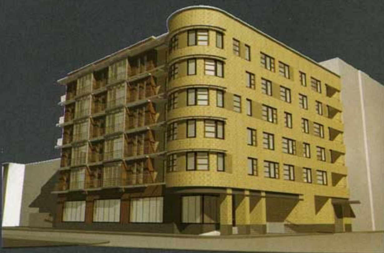
Жилой дом с подземной автостоянкой на улице Бурденко Москва, ул. Бурденко, дом 10/2. Строительство – 2000–2001 гг. Архитекторы: Сергей Скуратов, Константин Ходнев

Не могу не упомянуть, пожалуй, самую известную работу компании – многофункциональный комплекс с детской стоматологической поликлиникой в 1-м Щепиловском переулке, которая стала лауреатом первого конкурса “Золотое сечение”. Среди наших работ были и другие лауреаты этого престижного творческого смотря, в частности, проект станции технического обслуживания “Субару”, которая сейчас строится на Аминьевском шоссе. Буквально на днях мы получили диплом Московского конкурса “Реставрация-99” за реконструкцию и реставрацию главного фасада жилого дома начала XX века в Чистом переулке.