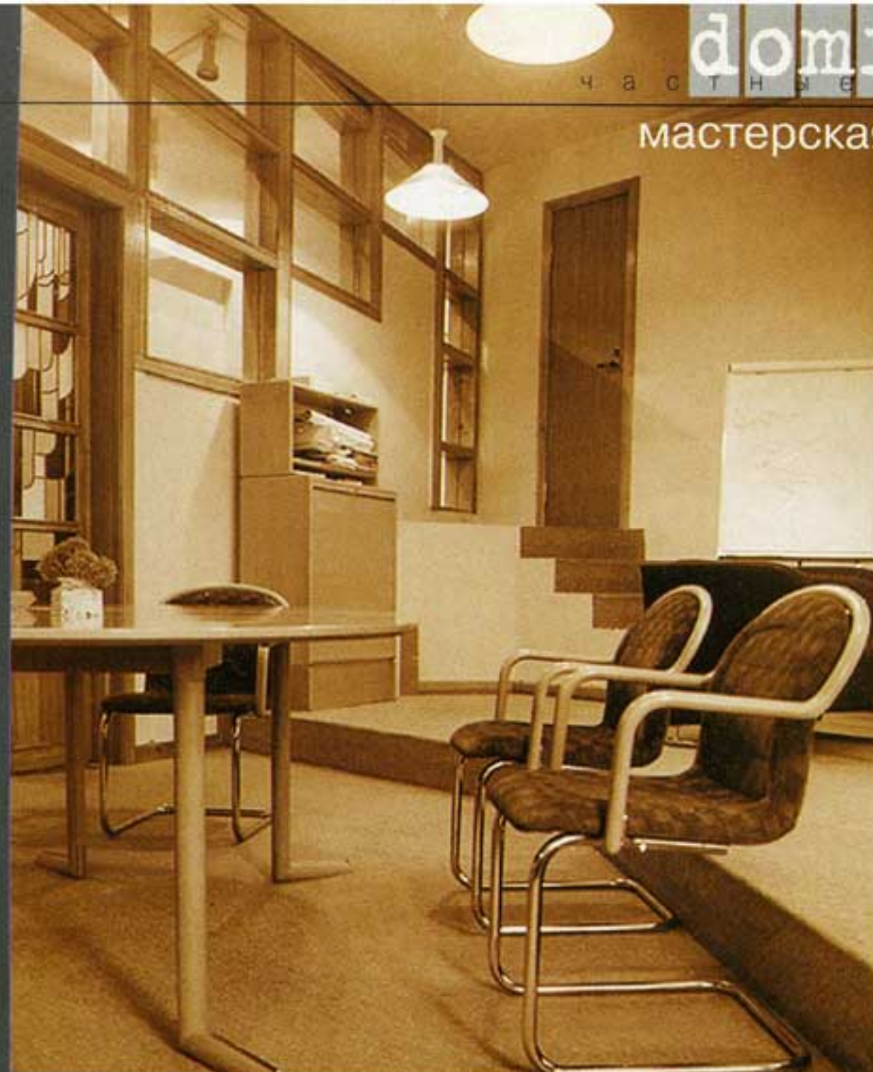
Штаб-квартира Международного фонда за выживание и развитие человечества Москва, ул. Веснина, дом 9/5, кв. 22. Строительство – 1988 год Архитектор Сергей Киселев

Надо сказать, что, предлагая неординарные решения, мы практически всегда встречаем взаимопонимание в городских структурах, чем может похвастаться далеко не каждая архитектурная команда. И дело, конечно, не в компьютерных моделях, а в том, что главная наша забота – поиск компромисса между интересами коммерческого заказчика и города. И, как правило, найти его нам удается. В этом плане очень показателен проект реконструкции Центрального телеграфа.