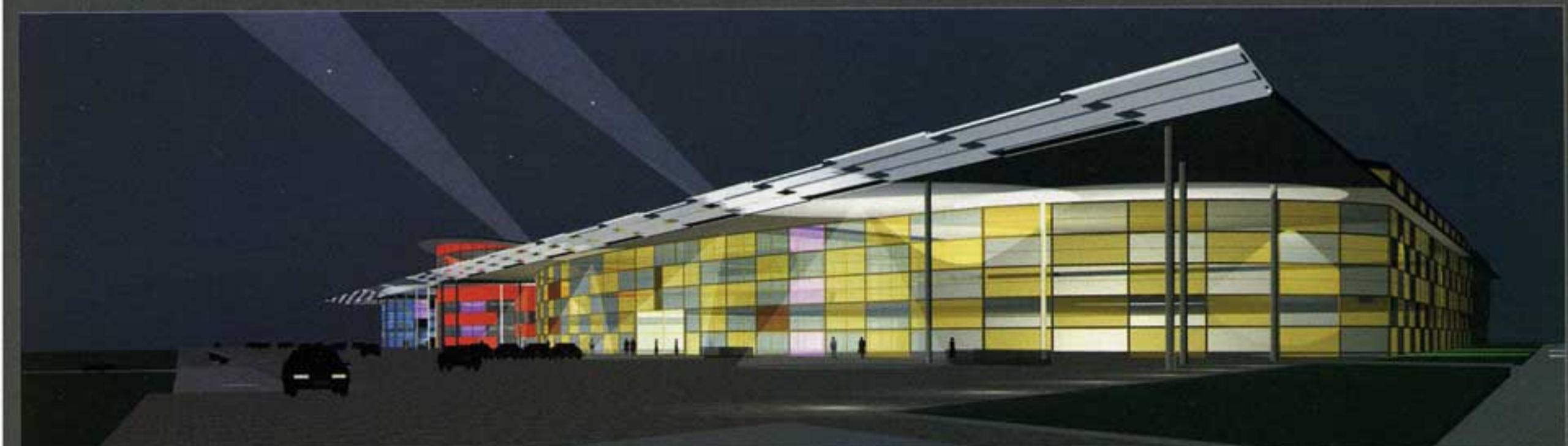
Многофункциональный торговый комплекс на пересечении Горьковского шоссе и МКАД

Благодаря таланту наших архитекторов и оригинальным методикам проектирования нам нередко удается существенно превышать градостроительные регламенты. Например, на площадке жилого дома в Зубовском проезде по предварительному градостроительному заданию требовалось воссоздать трехэтажное строение площадью 870 кв. м. Заказчик хотел шесть тысяч и получил их. Но прежде чем отыскать ту единственную идею, которая позволила в нужном направлении манипулировать простран-