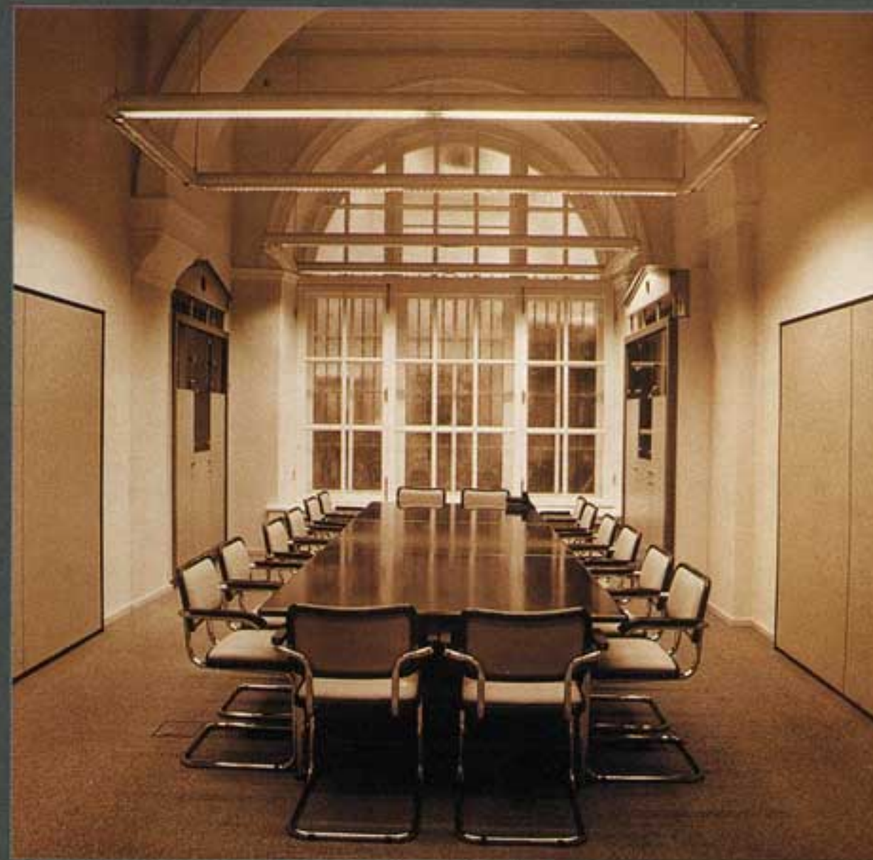
Представительство "Бурда Моден" в Москве