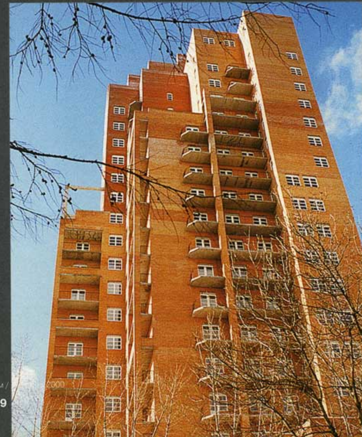
Многоэтажный жилой дом со встроенной поликлиникой и гаражом Москва, Ленинский пр-т, дом 77-79. Строительство – 1995–2000 гг. Архитекторы: Сергей Киселев, Михаил Чирков

Что же касается повального увлечения московских архитекторов псевдоисторизмом, то корни его, как мне кажется, надо ис-