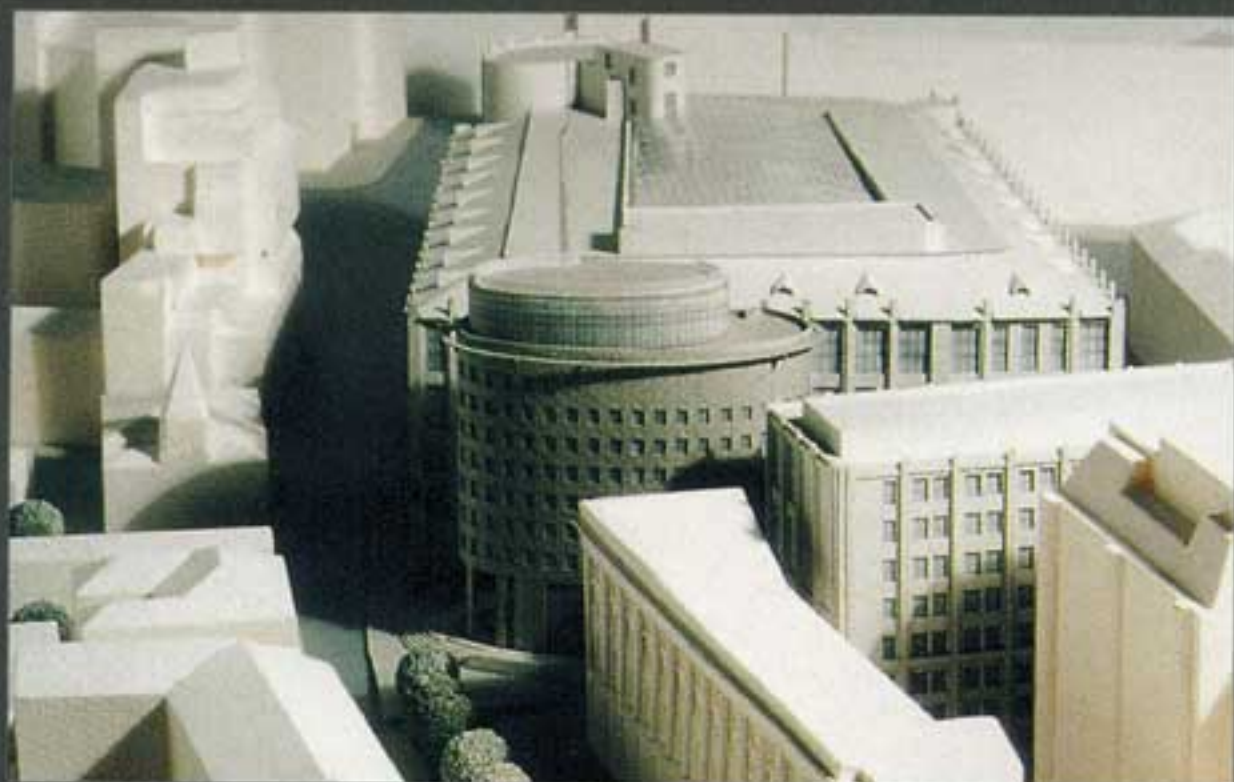
Современный дом / №5 (18) / 2000

Москва, ул. Тверская, дом 7, корп. 1 и 3. Архитекторы: Сергей Киселев, Вячеслав Богачкин, Николай Белоусов, Валерий Швецов, Анастасия Хомякова, Галина Харитоновна. Архитектор-реставратор: Лариса Лазарева