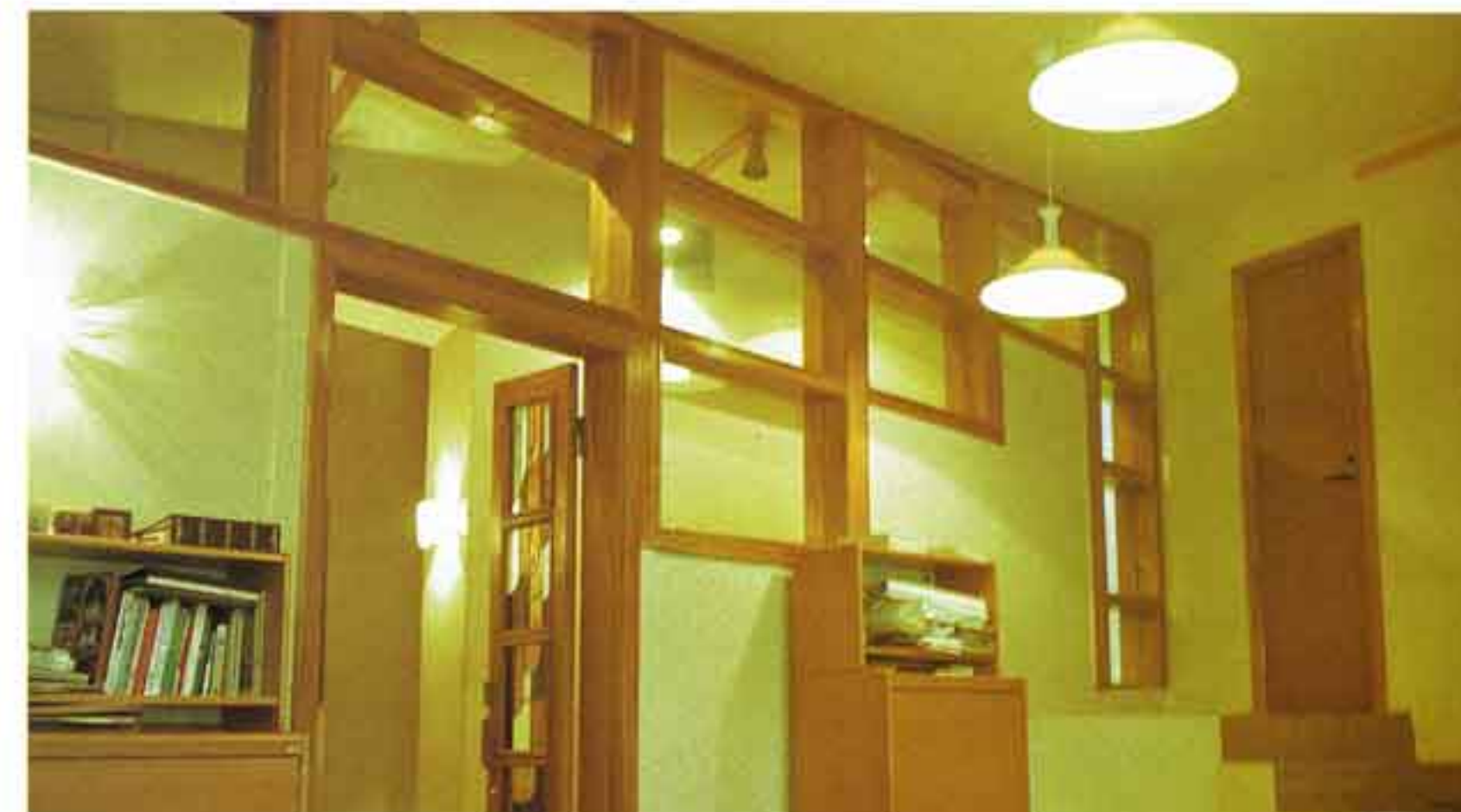
Интерьеры Московской штаб-квартиры Международного фонда за выживание и развитие человечества Представительство СП «Бурда моден» в Москве. Авторы: С.Б. Киселев, С.Ю. Попов при участии И.М. Долинской

Что было позже, трудно вспомнить, — было несколько проектов, сделанных в ГипроНИИ, но, к сожалению, не реализованных, какие-то интерьеры... Привычка или даже потребность зарабатывать дополнительно, помимо основного места работы, осталась. Ведь, как говаривал Лис, «мы в ответе за тех, кого приручили». Дочки уже две и жена красивая... Вскоре началась перестройка и оказалось, что существуют люди, которые ко мне давно присматриваются, и в качестве «халтуры» мне была ими предложена интересная серия работ, связанных с интерьерами баров в гостиничном комплексе «Измайлово». Я уже сделал эскизы трех баров, когда вынужден был