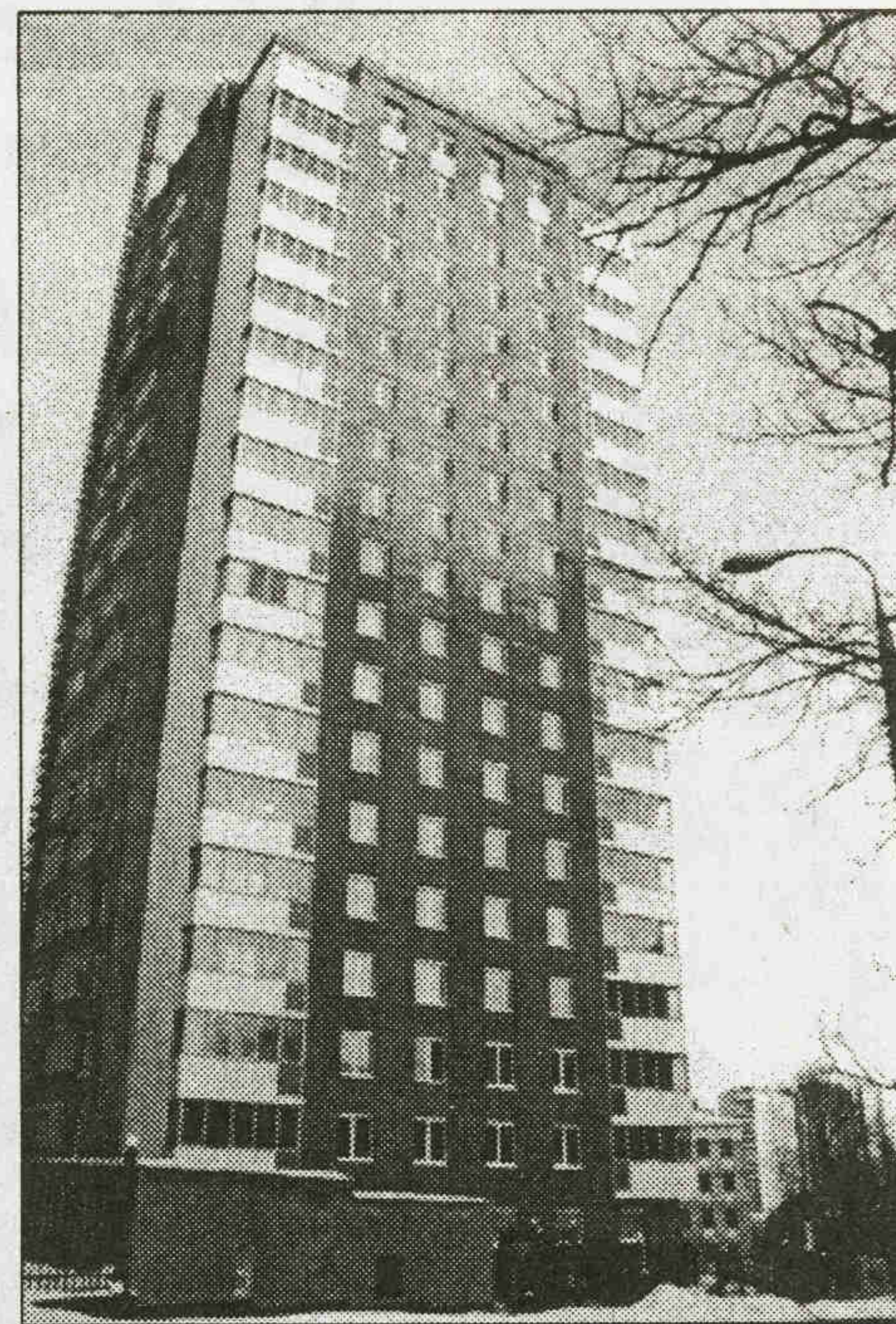
Просто, честно, современно. (Жилой дом на Звенигородской улице. Архитектор Юрий Гомон. ТПО «Резерв».)

Самое странное, что в прошлом году тот же архитектор выстроил в тех же цветах и с теми же хай-течными детальками весьма симпатичный технический лицей в Тихвинском переул-